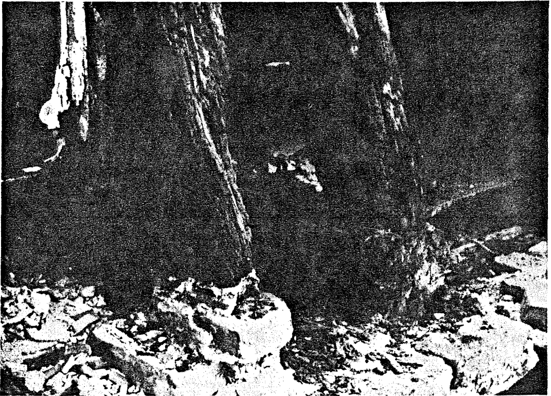
Billedet viser murværkets ringe tilstand og tagværket og etageadskillelsens stærke forfald.